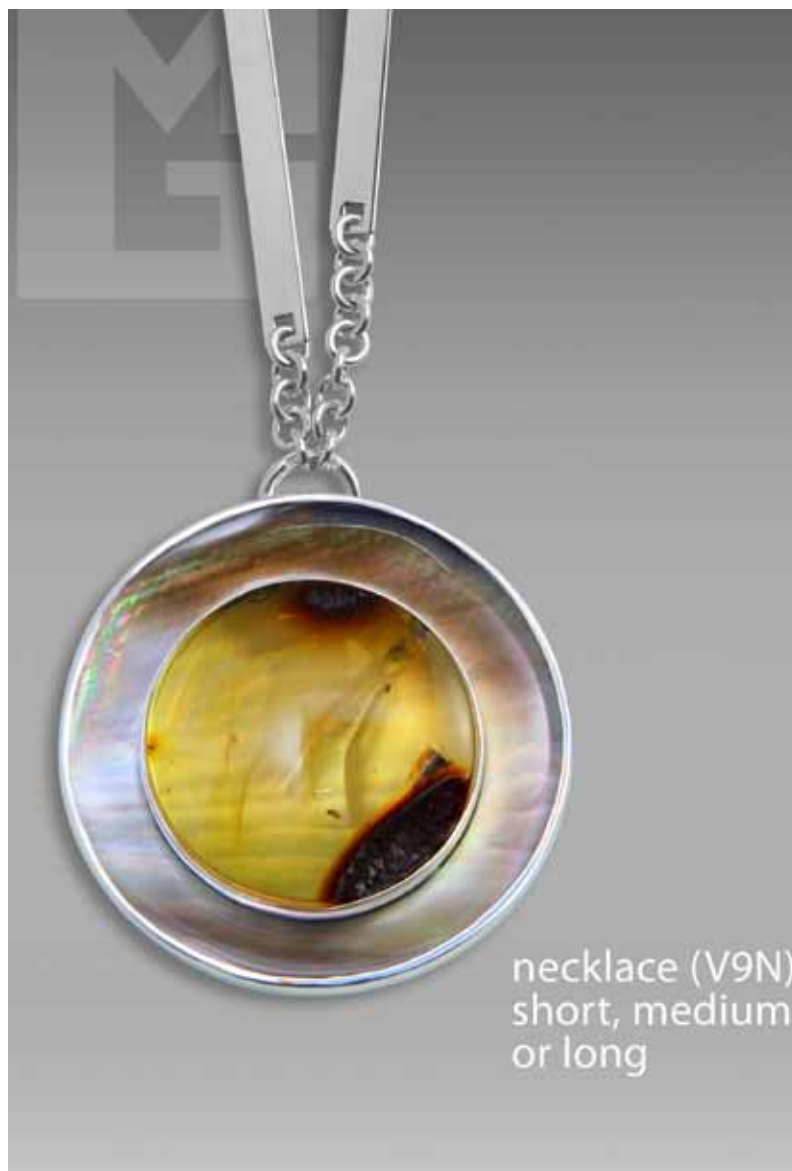
necklace (V9N) short, medium or long